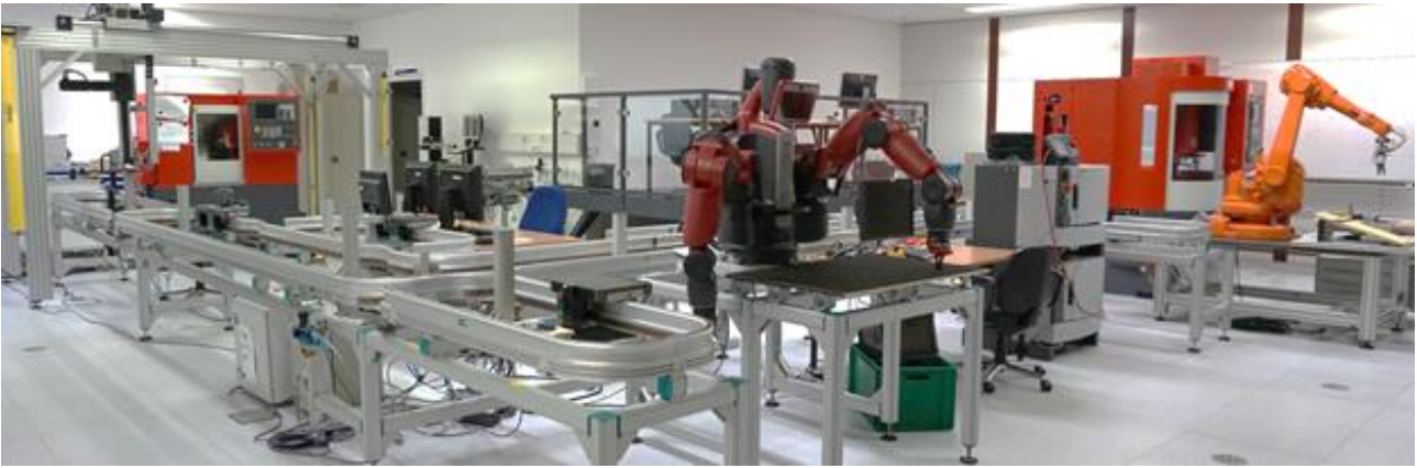
Bild 1 Smart Automation Laboratory

Die Laborumgebung ermöglicht es hierbei, Szenarien der Produktion des betrachteten Unternehmens durchzuführen ohne Störung der realen Produktion oder Abbildung aufwändiger Gegebenheiten wie zum Beispiel Security-Voraussetzungen einer realen Produktion. [5]